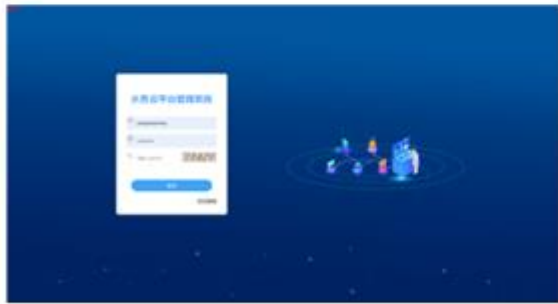
水务云客户管理系统