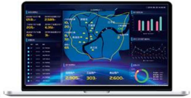
燃气云客户管理系统