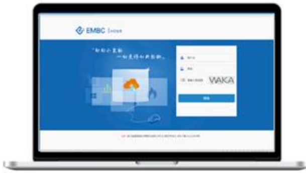
燃气云客户管理系统