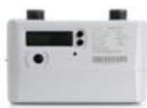
民用超声波燃气表

超声波计量仪表是利用超声波在介质中传递的时间差进行计量的新型计量仪表，它是一种高可靠性、高精度、带温压补偿的全电子式仪表。公司充分运用超声波计量技术精度高、易于实现智能化等特点，向运营商提供全电子一体化的先进计量解决方案，满足运营商对计量终端设备长期保持计量准确度的要求，凭借实时温度补偿、耐低温、宽量程等技术优势，改善运营商供销差问题，全面解决日常计量、用气安全监测、漏损监测等需要。