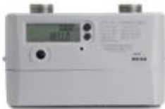
商业超声波燃气表