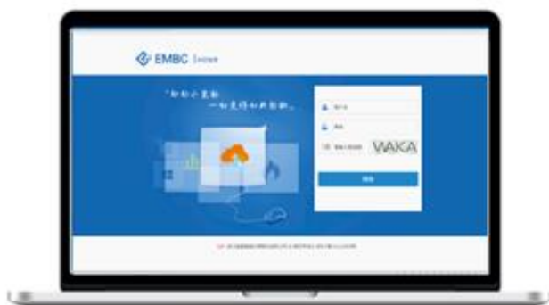
燃气云客户管理系统