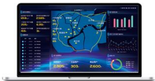
燃气云客户管理系统