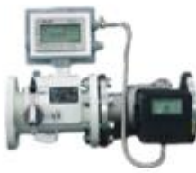
工业智能燃气流量计（控制器）