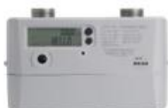
商业超声波燃气表