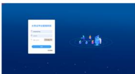
水务云客户管理系统