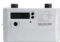
民用超声波燃气表

偿的全电子式仪表。公司充分运用超声波计量技术精度高、易于实现智能化等特点，向运营商提供全电子一体化的先进计量解决方案，满足运营商对计量终端设备长期保持计量准确度的要求，凭借实时温度补偿、耐低温、宽量程等技术优势，改善运营商供销差问题，全面解决日常计量、用气安全监测、漏损监测等需要。